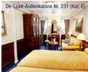
De-Luxe-Außenkabine Nr. 231 (Kat. E)