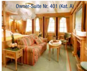
Owner-Suite Nr. 401 (Kat. A)