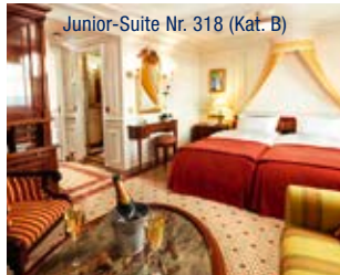
Junior-Suite Nr. 318 (Kat. B)